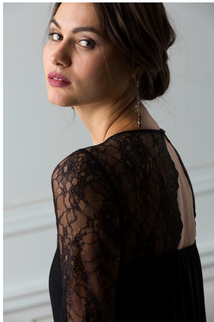
Combi-pantalon détails dentelle • 59.95 € - escarpins • 39.95 €