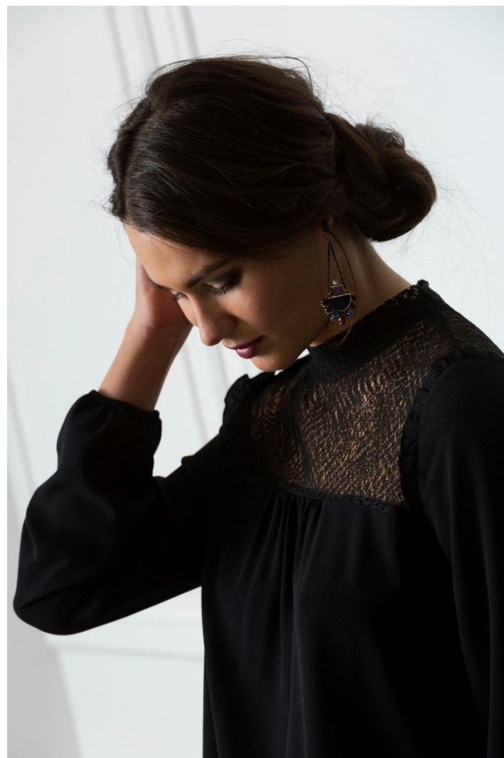
Blouse col victorien • 29.95 € - jupe droite en cuir • 69.95 € - boots à talons • 59.95 €