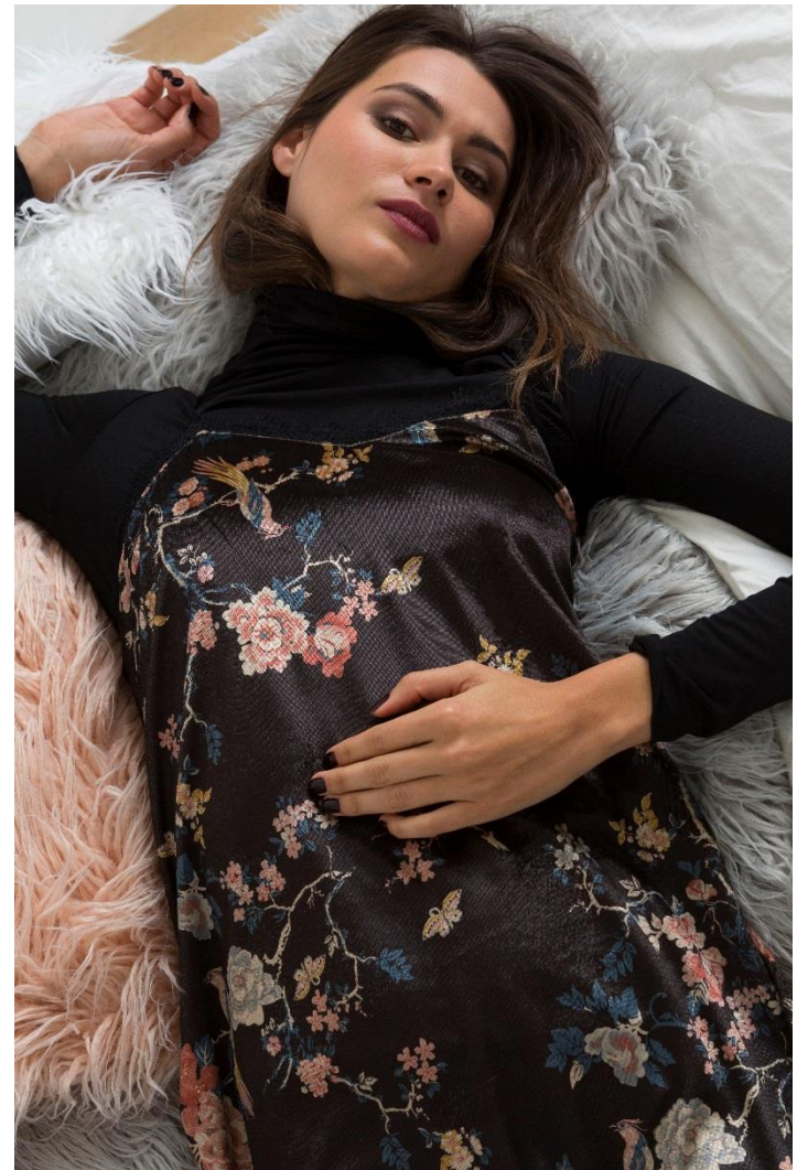
Top col roulé • 9.95 € - Robe imprimée panne de velours • 34.95 €