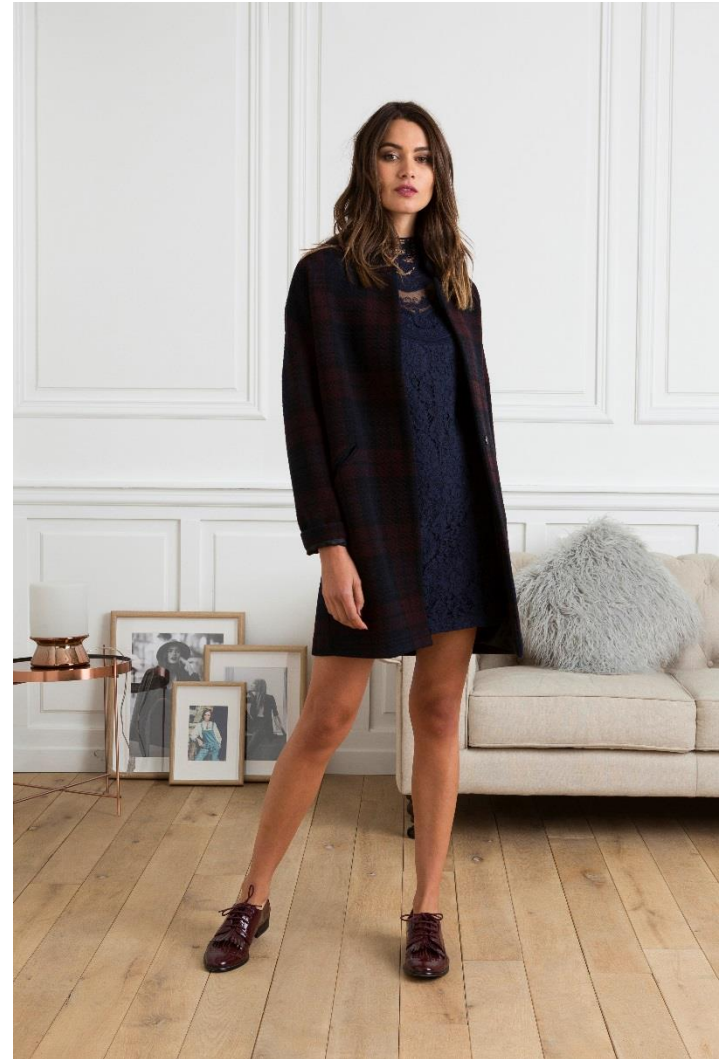
Robe dentelle • 59.95 € - Manteau en tweed à carreaux • 89.95 € - Derbies à franges • 49.95 €