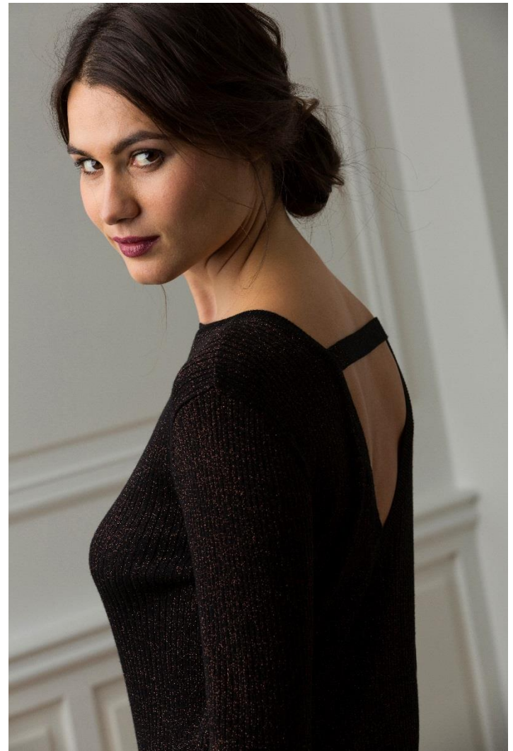
Robe lurex longueur midi • 39.95 € - boots à talons • 59.95 €