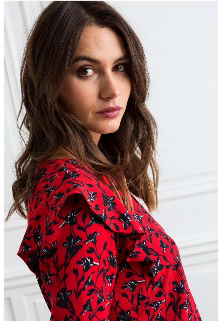
Robe imprimée détails volants • 44.95 € - Boots à talons • 59.95 €